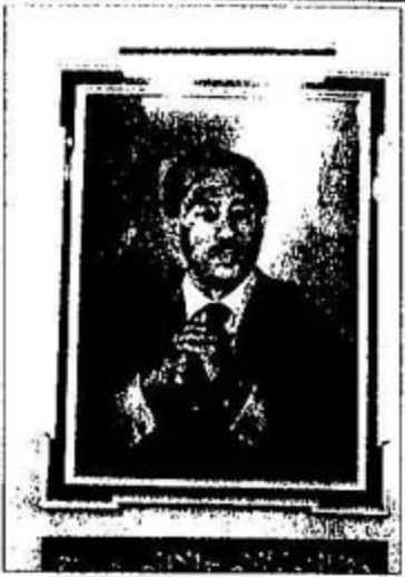
اللوحة الرئيسية بالمتحف