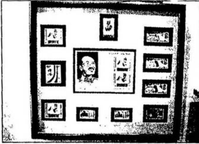
طوابع البريد التذكارية التي صدرت في مناسبات مختلفة