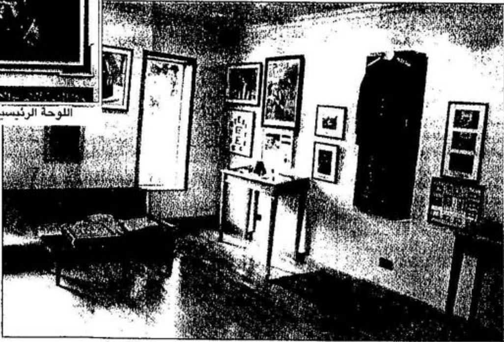
المكان الذي تعود السادات الجلوس فيه وأمامه المصحف الشريف