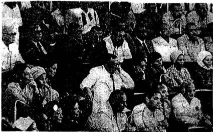
أعضاء مجلس الشعب والسوري يصفون باهتمام إلى خطاب الرئيس .

مركز الأهرام للتنظيم وتكنولوجيا المعلومات