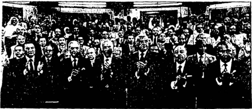
شكر رجال الثورة واعضاء المجلس بمقر الرئيس المسكنات لمساحة بمسوره قادة الجيش لاقاء خطبه التاريخي