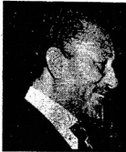
□ الرئيس السادات

أعلن الرئيس أنور السادات أن مصر حصلت — بمساعدة الملك فيصل والملكة السعودية — على أنواع معينة من الأسلحة كانت تنقصها .. وكان من المنتظر أن تأتي الذكري الأولى لحرب أكتوبر ونحن