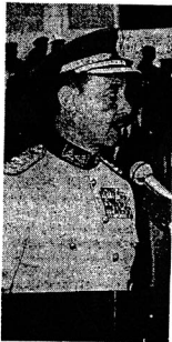
الفريق اول الجمسى أثناء القاء كلمته فى العرض المسكرى امس

ونسى هؤلاء ان المقاتل المصرى والعربى يتغلب بأصراره على كل العقبات وانه يحارب معا بآيمان بما يتوفر له من اسلحة وذخيرة ومدات وان التخطيط السليم والتنفيذ الشجاع والروح المعنوية العالية هى من الموامل التى