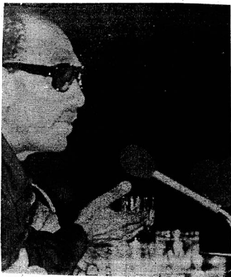
الرئيس : رسالة الفن من أروع وأخطر الرسائل

مركز الأفرام للتنظيم وتكنولوجيا المعلومات