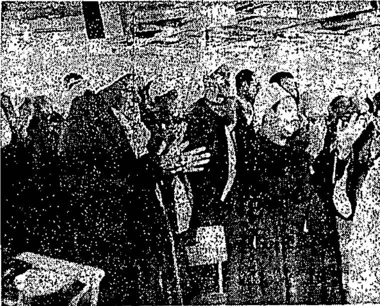
• الصيادون تجمعوا كلهم لتحية الرئيس السادات بالتصفيق والهتاف ..