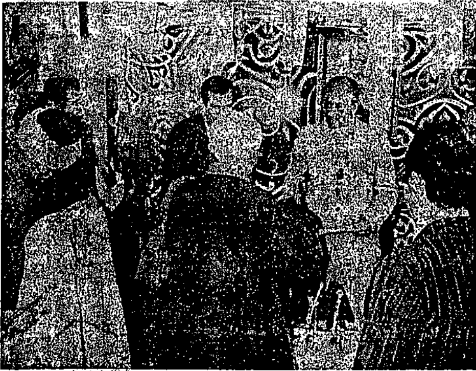
• الرئيس السادات يقوم بتوزيع مستندات تملك مركبا. ألبا على الصيادين في بحيرة الأسد العالي . .