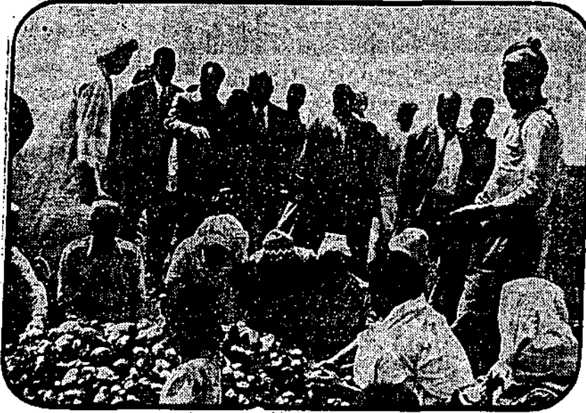
● محصول الاراضي الجديدة من البطاطس يجري امتداده لطرحه في الاسواق ..

التي دعا الرئيس السادات أعضاء مجلس الشعب لرؤيتها على الطبيعة في الاسماعيلية