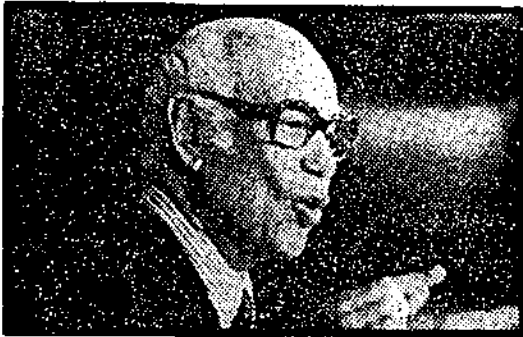
● المهندس سيد مرعى

وقد قال المهندس سيد مرعى مساعد رئيس الجمهورية ورئيس هيئة المستشارين ان الرئيس قد ناقشه عند اجتماعه به يوم الثلاثاء الماضى في عدد من المحاصيل الزراعية وتنمية انتاجها وكلفه ببحث هذا في هيئة المستشارين وكان « السكر » من بين ما جرت مناقشته وأشار في هذا الصدد الى « ندوة الأهرام » التي نشرت بقسمها يومى الجمعة الماضيين ، والتي جاء فيها انه اذا استمر انتاجنا من السكر كما هو مستبلغ قيمة ما نستورده منه العام القادم كل بخلفنا من قناة السويس ! واننا ننتج من السكر نحو ٧٠٪ من استهلاكنا والباقي نستورده ويبلغ نحو ٤٠٠ الف طن سعر الطن ٨٠٠ دولار أى ٢٢٠ مليوناً سنوياً وعلى هذا الأساس ستكون هناك اولوية للسكر بالاعتماد على البنجر الذى نجحت زراعته في شمال الدلتا وكان هناك مشروعان كما يقول المهندس سيد مرعى - اولهما في كفر الشيخ وقد تم تنفيذه والآخر في النوبارية وسوف يتم اختيار منطقة ثلاثة لمشروع ثالث لزراعة البنجر .