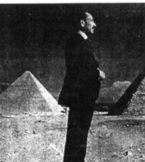
نهاية سعيدة لعام ٧٧

انتهى عام ١٩٧٧ نهائية سعيدة بأبل يبشر بالسلام .. رحلة السادات الى القدس اعتبرت حدث العام الذي احتل مكان الصدارة في الجسلات والجراند العالمية وقد كتبت « النيوزويك » ان السادات ركع في المسجد الأقصى وانجسه نحو التكية وبهذا بدأت صلاة السلام في العالم .