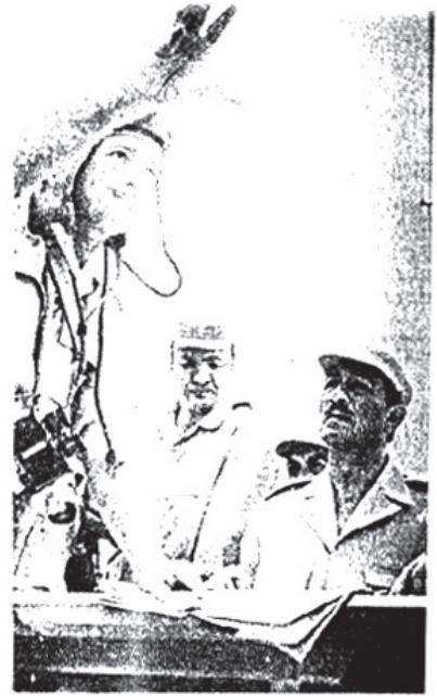
الرئيس السوداني في أحد مندوبات الدفاع التي قامت بها فوراً في فترة الإعداد المرمكة ..