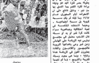
بارة لادني والخيرو في بين

بارة لادني والخيرو في بين بارة لادني والخيرو في بين ، وهي بطلة في كرة الطائرة ، وقد سجدت في ركوع الخشوع والطمأنينة ، وشكرت على كرمها على ما فعلت بي من الخير