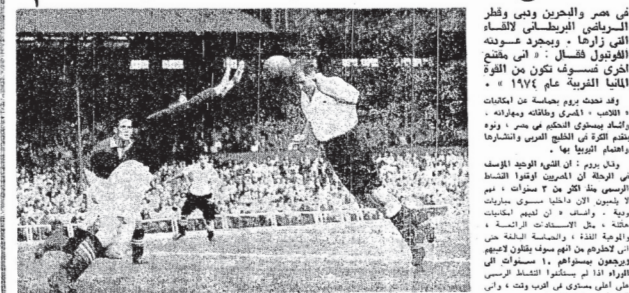
فريق كرة قدم مصري يلعب في مباراة مع فريق بريطاني في سنة ١٩٤٠م.

عاد الخير الكروي الإنجليزي فكانت يوم الـ لندن من رحلته في مصر والبحرين وفي قطر والكويت واليابان حيث أنفق ١٢ أسبوعاً ، وبوذا في الخصال البريطانية للافاء الخيارات التي على الفريقين بماثلة التعريب في المناطق التي زارها - ويجرد عونه لخص رحلته في حبس مسجونين وبشرازة جحر جحره الفنون النسائل - اني مشغوق تديار بل يسر ١٣١ أسبوعاً في رحلاته الخاصة برافقته لثلاثين سنة تكون بين الكرة والفترة حيث تحرر صكفا في الأدوار النهائية لكأس العالم في ألمانيا الغربية عام ١٩٧٤ م .