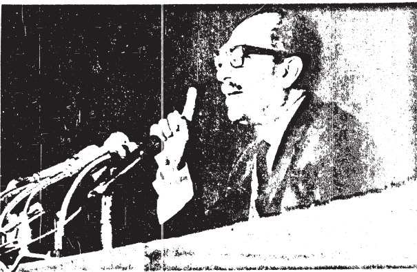
الرئيس انور السادات وهو يكلف في اجتماع المؤتمر القومي المشترك ادارة الحوار في ضوء المتغيرات السياسية العالمية

الرئيس السادات يكلف المؤتمر المشترك ادارة الحوار في ضوء المتغيرات السياسية العالمية عرض نتيجة الحوار على المؤتمر القومي في سبتمبر خطاب هـم للرئيس في يوم ثورة ٢٣ يوليو