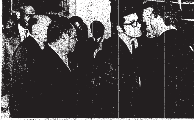
مجلس الوزراء يلقى خطابا سياسيا هاما في جامعة الاسكندرية

وقد تولى هذا الإعلان من الرئيس بمصاحبة من التصديق والموافقة بيدها له اتحاد طلبة جامعة الاسكندرية في بداية اللقاء مهم : التي بكل مديان وشكر ، انقل هذه الية ،