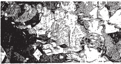
بين الذين همروا في سنة ١٩٦٥ في الثورة... تشيكا في جمهورية التشيك والاميرين