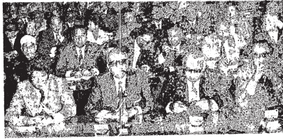
الجنرال الاميرين... تشيكا في جمهورية التشيك والاميرين