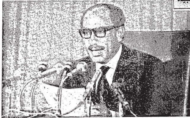
الرئيس السادات وهو يلقي خطبه في الاحتفال بالتسعين والاربعين لثورة يوليو