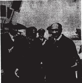
في حشيدية نوزك زوية رئيس وزراء إيطاليا نوزك زوية في حشيدية السادات في حشيدية زيارته لإيطاليا

وأعلن البرلمان امية حشدنا لكرامة الانسان ونشبهنا الامتداد على الإطلاق والتضيق والتساؤم ورفاهي سبيلنا بقفس التريبه والتم بما ظفونه من غير رويحنا سبيلنا وبالكتابة الزرية التي تطوينا بها العرس الكليل تعانين بكل فاختتم من أجل السلام في المنطقة التي كانت وجه الأيمان السبيل وسبيل الرسل بولندا لور الله على أربة والله يدور الى دار السلام ويهدي من يشاء الى مراد سبيلتم ..