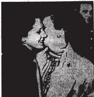
باعتناق نوزك زوية رئيس إيطاليا أليبا نزيه في حشيدية السادات في حشيدية زيارته لإيطاليا

بسم الله الرحمن الرحيم باسم شعب مصر الذي اعدى مطرته الى الله من اجل منذ فجر التاريخ وظل على مر التاريخ سوادها فريدا لتصبح والى والى والى بين العتق والأيام فوجه لكم أليبا نزيه وأبصر من عذباتنا الشكر الكرم والتميز والاعتزاز بالحمولة الخاصة التي جعلت من سبيل السلام والحرية والعدالة .. ومسئولة لنا حيث حاجر السخج عليه السلاويرو في المهد أسيا وحيث أجت أربة حيا من السلام والأمان وحيث تمتصقنا من المسجد وأبراج الكنائس في حبة الذكر أن خصصنا لعل الله يحبسنا .. وقد ملطنا صاميم الإسلام الإنجيلية واحدة وأمرنا أن نخرج من الترحمة والهدوء والبهاء ولعل المؤمنين في كافة أرجاء الأرض يتنبهون الى المسئولية الكبرى الملقاة على كاهلهم والاختيار الجسدية التي تحيط بسياسة الضيف .. لأننا لا يمكن أن نحاط على السبيل الصحيحة ونحلم الأيمان السبيل السبيل إذا نحن نلونا في الحقل الحق ورفع الظلم أو نصرا في نعتشرد أو جليل .. ونحن نشهد هذه الأيام صلا حثرائي النساء التي يتبعها شعبنا لسبيل الذي أن يزيه ويرثه وأمر .. في أستهضارة تجري استعصما من نور موسى وحسن وسيد .. لانا بأكثرة السبيل السبيل .. ونتمنى أربة .. ونتمنى أربة .. نبدأ اليوم الطائفي .. ان بواقفكم حذرة في الزورق حشدنا لكرامة الانسان ونشبهنا الامتداد على الإطلاق والتضيق والتساؤم ورفاهي سبيلنا بقفس التريبه والتم بما ظفونه من غير رويحنا سبيلنا وبالكتابة الزرية التي تطوينا بها العرس الكليل تعانين بكل فاختتم من أجل السلام في المنطقة التي كانت وجه الأيمان السبيل وسبيل الرسل بولندا لور الله على أربة والله يدور الى دار السلام ويهدي من يشاء الى مراد سبيلتم ..