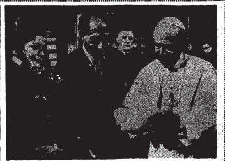
إلى أعلى : تم الرئيس السادات ( إلى اليسار ) .. وقدم أليبا ألبا نزيه من الإسكندرية ، حشيدية إلى سعادة مكتب ألبا نزيه ، حشيدية إلى الرئيس السادات . منظرًا لزيارته .