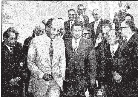
الرئيس السادات عقب اجتماعه بأعضاء المجلس الأعلى للجامعات والى جانبه السيد حسني مبارك نائب رئيس الجمهورية ، يمينه حسن الرزقي

التنظيمات الشيوعية السرية استغلت الشرعية في التخريب تنسيق بين قيادات حزب التجمع والقيادات الشيوعية في الضمير الحكومة مستعدة لتضع أمام مجلس الشعب كل البراهين المؤيدة لهذا التساؤل كل السموم سامم وليس الزهر في جناس التسبب اس اس العاصم الشيوعية المطردة سيطرت على حزب النصارى الوطني القديم ، وانها اليوم نلح بلانقلبها لتزجج الموت وسيليشيوسمترينك ، ويمثل ان هذه المنظمات الشيوعية السرية بأيدى شياها مسروبة بالشرع من خلال حزب التجمع ، وهدمت الحرب في الآلات الأبرهوان هناك سيطرة تسوية من مناب هذا الحزب التي تمليها القادة الشيوعيين والنصارى بالجنون من أعضاء الأهرام الشيوعية.