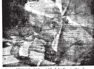
يستمع يمين رئيس وزراء اسرائيل ابراهيم ابيطال لخطبة خطاب الرئيس

حتى الولايات المتحدة حليفكم الاول تؤمن الان بان القضية الفلسطينية هي جوهر المشكلة والا وجدت لمن يسبح لها صوت . وصوروا هي القاتل سلام في حين تزعج الى العالم المصائب الى السلام .. اولا : انهوا الاحتلال الاسرائيلي للاراضي العربية التي احتلت في عام 1977 . ثانيا : تحقق الحقوق الانسانية للشعب الفلسطيني وجعله في طريق ثالثا : حل كل دول المنطقة في الميثاق في سلام داخل حدودها الامنة والمضمونة من طريق اجراءات ينقل عليها حقوق ان السلام ليس توفيقا على اسخورد ان نلقى الانسان في كل مكان .. من