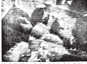
يستمع يمين رئيس وزراء اسرائيل ابراهيم ابيطال لخطبة خطاب الرئيس

سلمان قوة السلام نعنا ان نصلح - الانساني بكل قوة القمم والاداريه التي تلعب مكانة الانسان واذا سخطتم في ان توجه بذاتني من هذا الخبر التي تخص اسرائيل .. فاني اوجه بكلمة المشايخ الفلسطينية التي كل رجل وامراه وكل طفل من اسرائيل ببارة هذه الرسالة القويمة من اجل السلام اسلم اللهكم برسالة السلام والصلح من الذي يربطه الشعب ، والذي يعيش ايامه ، من اجله وسيسبح ويحمد بورح الله والصلح والانسجام . هذه هي صبر ، التي جعلت شعبنا لغة الرسالة القويمة ، ورسالة الامن والامان والسلم .