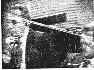
يستمع يمين رئيس وزراء اسرائيل ابراهيم ابيطال لخطبة خطاب الرئيس