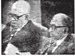
يستمع يمين رئيس وزراء اسرائيل ابراهيم ابيطال لخطبة خطاب الرئيس

في هذه المَشُورِ صفحة هذا خطبته التي لم تسمع 131 خلاصة القول وقد الفصل لترار السلام القائم العادل لكل الاجيال من صحتنا اي بالنسبة للقضية الفلسطينية نفس هناك من ينكر انها جوهر المشكلة كلها وليس هناك من مثل اليوم في العالم كله تتمتازت وتتمتع هذا في اسرائيل تتعامل وجود شعب لشعبين بل وشعبين اثنين هو هذا الشعب !!