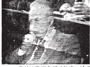
يستمع يمين رئيس وزراء اسرائيل ابراهيم ابيطال لخطبة خطاب الرئيس

مع الاحتفال ولكن كيف يجرى هذا كله يمكن ان نصل الى هذه النتيجة التي نصل بها الى السلام القائم العادل هناك خلافات ابد من مواجهتها بكل شجاعة وروح شجاعة وبريرة اخلاقيتها - ولا تزال تعتادها - اسرائيل بالقرعة المسلحة ومن نصر على تحقيق الاتساق الكامل معها بما فيها العنصر العربي .. الضمين الذي شهرته اليها وبالقرعة مبدعة السلام .. والتي كانت وسوسه نطل على الوفاق التقديس الذي للقبائل بين الإرتين بالمبادئ الثلاث .