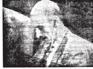
يستمع يمين رئيس وزراء اسرائيل ابراهيم ابيطال لخطبة خطاب الرئيس

بناء صرح للسلام بدلا من المصائب عنا كل رجل وامراه وكل في اسرائيل .. خصوصا انتمكم على حال السلام . ولوجه اليهودي الى بناء صرح الشايع للسلام ، بدلا من بناء اطلاق والكثير الاحصنة بصواريخ الدمار . قدوا للعلم كله ، صورة الانسان الذي في هذه المخطئة من العالم . لكي يكون صورة لشخص العصري .. انسان الحسن من كل موع وكلمة . يشربوا بانتمكم .. ان يا صبي ، حين اخر الحروب ونهاية الايام ، وان ما هو قادم هو البداية الجديدة ، لحظة الجديدة .. حياة الصفاء والخير والحرية والسلام وما فيها الامم الصغار وما فيها الوجة العربية . وما فيها الابن الذي نعد الاخ والابن وما في شعنا العرب . الارض الصبور والفرح ، بالسلام اعطوا الاشودة حقة نضج نضج اعطوا الامم دستور عمل ونظام . وآرادة التصويب هي من ارادة الله . ايها السادات والسادة .. قل ان اقول اني في هذا المكان ، توجهت بكل شدي في قلمي ، وبكل خلج في خيمتي ، الى الله سبحانه وتعالى وتانا اؤدي صلاة الدمى في المسجد الاقصى وعنبروا والاسئلة وما اوبى موسى وسوس المؤمنين من ريبه ، لا يرضى من احد منهم ، ونحن له مسلوبون . والسلام عليكم .