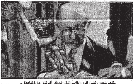
منتاح بيجين رئيس الوزراء الإسرائيلي لحظة التوقيع على المعاهدة .