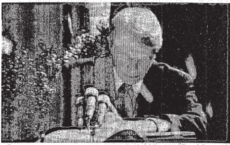
الرئيس الأمريكي يتوقيع المعاهدة .