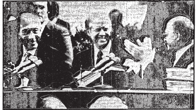
□ الرئيس انور السادات وبيجين يصفقان للرئيس الأمريكي عقب توقيعهم على اتفاقية السلام □

السادات في خطاب تاريخي بعد التوقيع: شعب فلسطين أحق بالمساندة الرئيس يدعو كارتر للدخول في حوار مع ممثلي الشعب الفلسطيني « لا بديل عن انتقال السلطة لشعب فلسطين واحترام حقه في تقرير المصير » الحكم الذاتي لا ينبع من الارادة الاسرائيلية ولن نقبل تجاهل حق الفلسطينيين