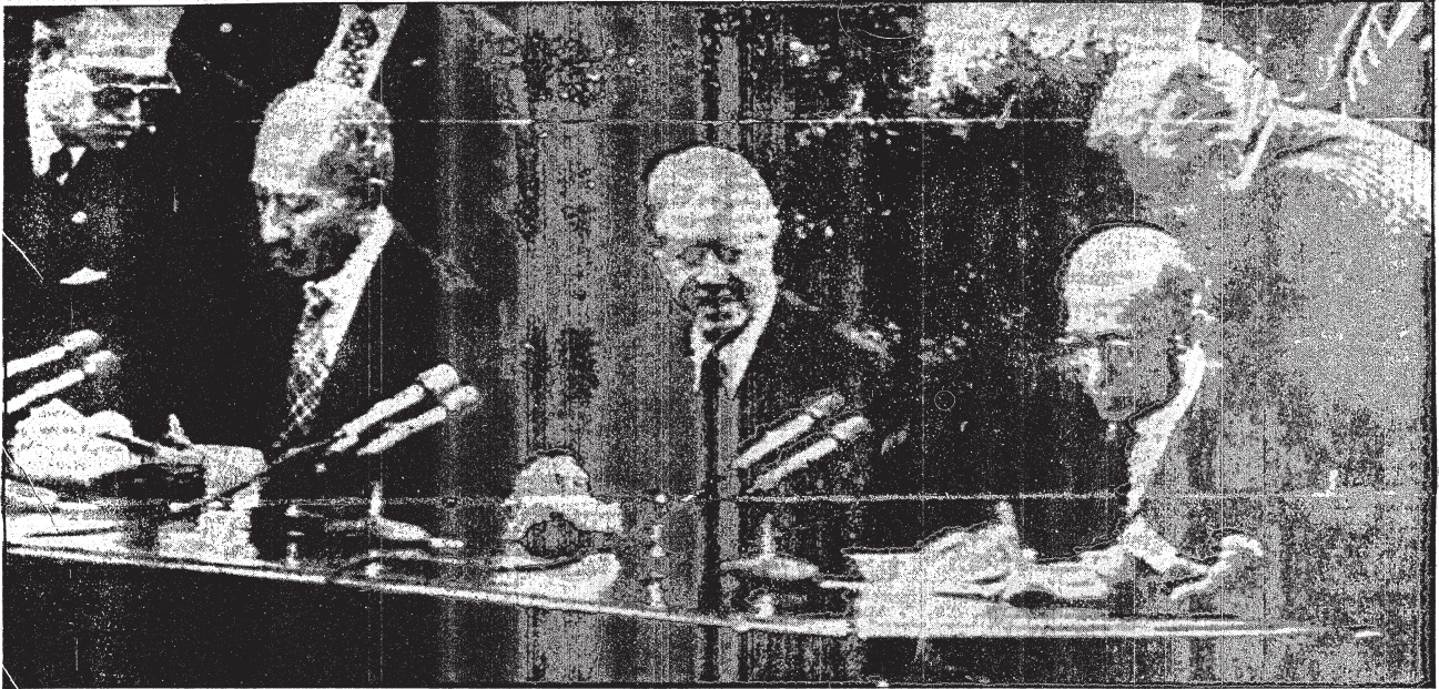
□ الرئيس كارتر يتوسط الرئيس السادات وبيجين خلال الاحتفال الذي تم فيه التوقيع على معاهدة السلام في البيت الأبيض أمس □

السادات وبيجين وقعوا أمس معاهدة السلام واتفاق الحكم الذاتي للفلسطينيين الإسحاب من العريش خلال شهرين ومن مناطق البتروول خلال ٧ شهور مصر تؤكد تصميمها على اختصاصات واسعة للحكم الذاتي خلال المفاوضات بعد شهر أمريكا تتعهد بالمشاركة في مراحل المفاوضات واسرائيل ملتزمة بالتسوية الشاملة رفع الحظر عن النشاط السياسي في الضفة وغزة والافراج عن المعتقلين الفلسطينيين في سجون اسرائيل