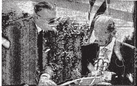
الرئيس السادات يتوقيع النسخ الثلاث لمعاهدة السلام بين مصر وإسرائيل .

فيما يلي نص كلمة الرئيس الأمريكي كارتير : خلال السنين لما المسية كانت العهود مكررة بين مصر وإسرائيل ، ولقد حصر إسرائيل في حرب مستمرة وخلال السنة عشر شهرا الأخيرة تباعدت مصر وإسرائيل الرغبة في السلام . والموقف يظل واضح ، لا بالنسبة لحمة عسكرية دائمة ، ولكن بالنسبة لحمة سلام ملهمة دائما وبعين تنوعها . ولكي نعيش على هذه الصمت لا نرى نطفة الحياة التي نرود ، وانما نرى القيد الذي نرود . ولكي نعيش على هذه الصمت لا نرى نطفة الحياة التي نرود ، وانما نرى القيد الذي نرود . ولكي نعيش على هذه الصمت لا نرى نطفة الحياة التي نرود ، وانما نرى القيد الذي نرود .