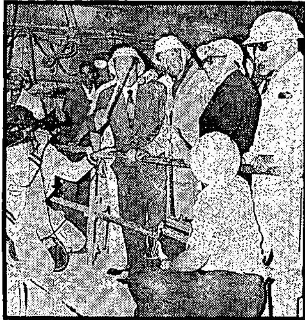
الرئيس السادات ينصت الى شرح عن تفاصيل المشروع من المهندس سليمان عبدالحى